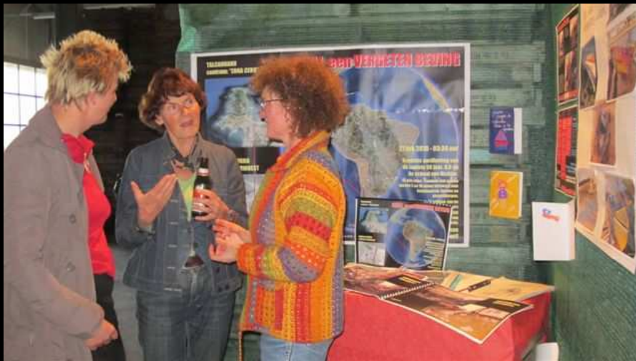
Presentatie van de st. Nederland helpt Chili.