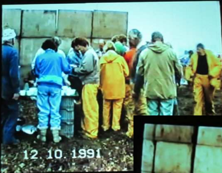
Erwtensoep tijdens de pauze