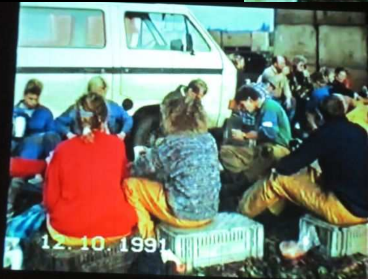
En de ervaringen van de dag uitwisselen