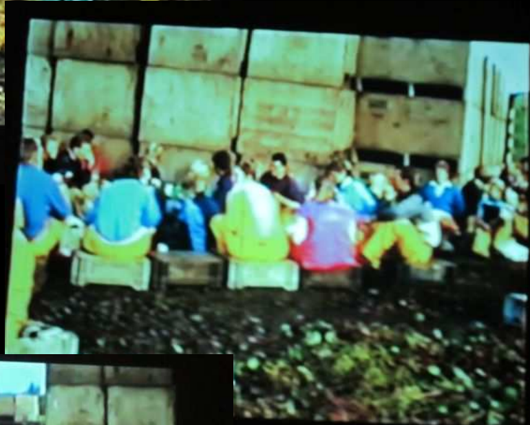
Een broodje, even uitrusten en een gezellig praatje