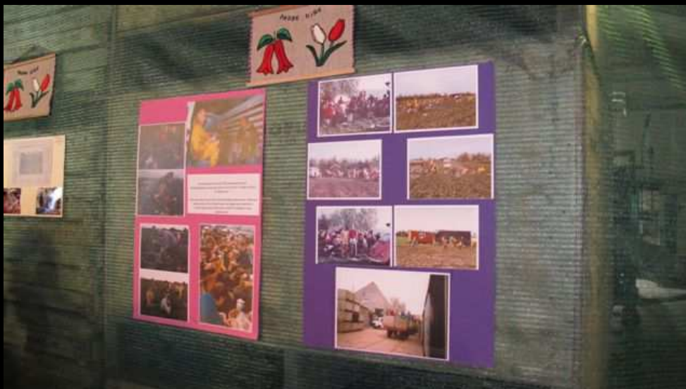
Informatie over de projecten in Chili en geschiedenis van de Bietendag