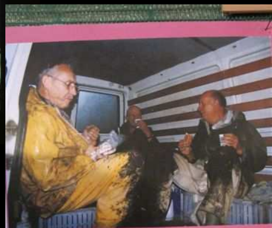
En als buiten regent ...